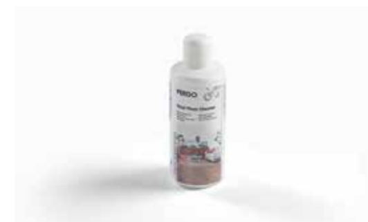
Pergo-vinylvloerreiniger 1L PGVCLEANING1000